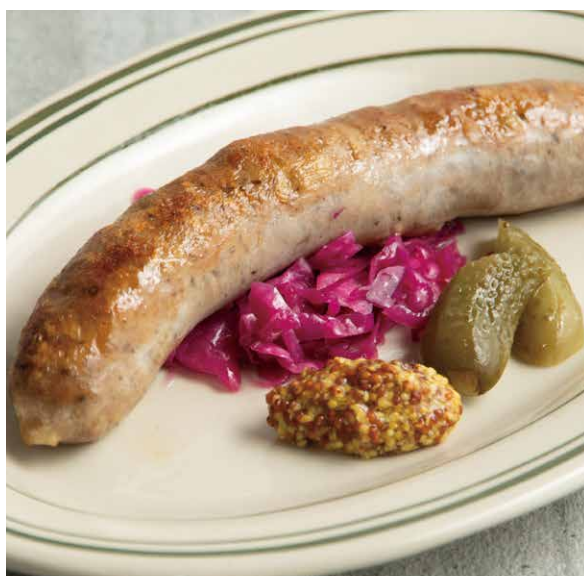
ソーセージ 700 Sausage