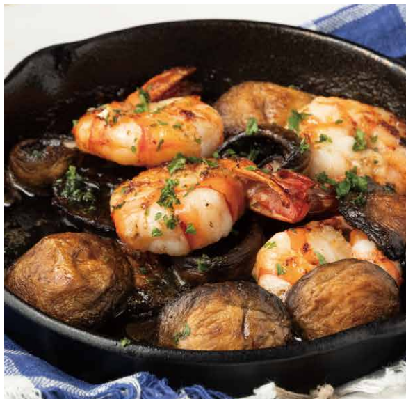
ガーリックマッシュルームシュリンプ 1200 Garlic Mushroom Shrimp