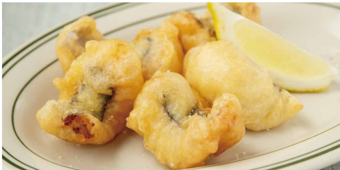
淡路産ハモのフリット 850 Awaji Conger Pike Fritters