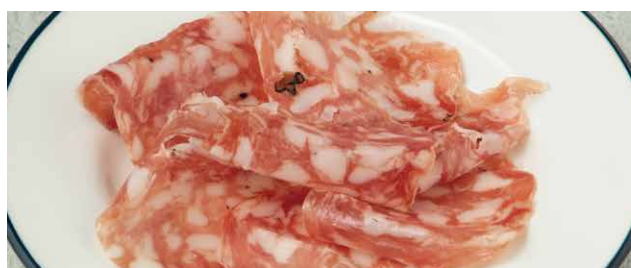
黒トリュフのサラミ Black Truffle Salami