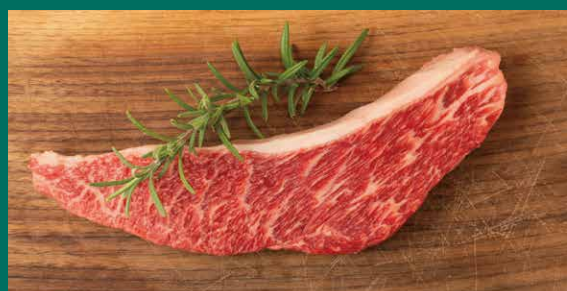
本日の和牛ステーキ

程よい噛みごたえと牛肉らしい濃厚な風味、赤身と脂肪のバランスがとれた肉質が特徴。