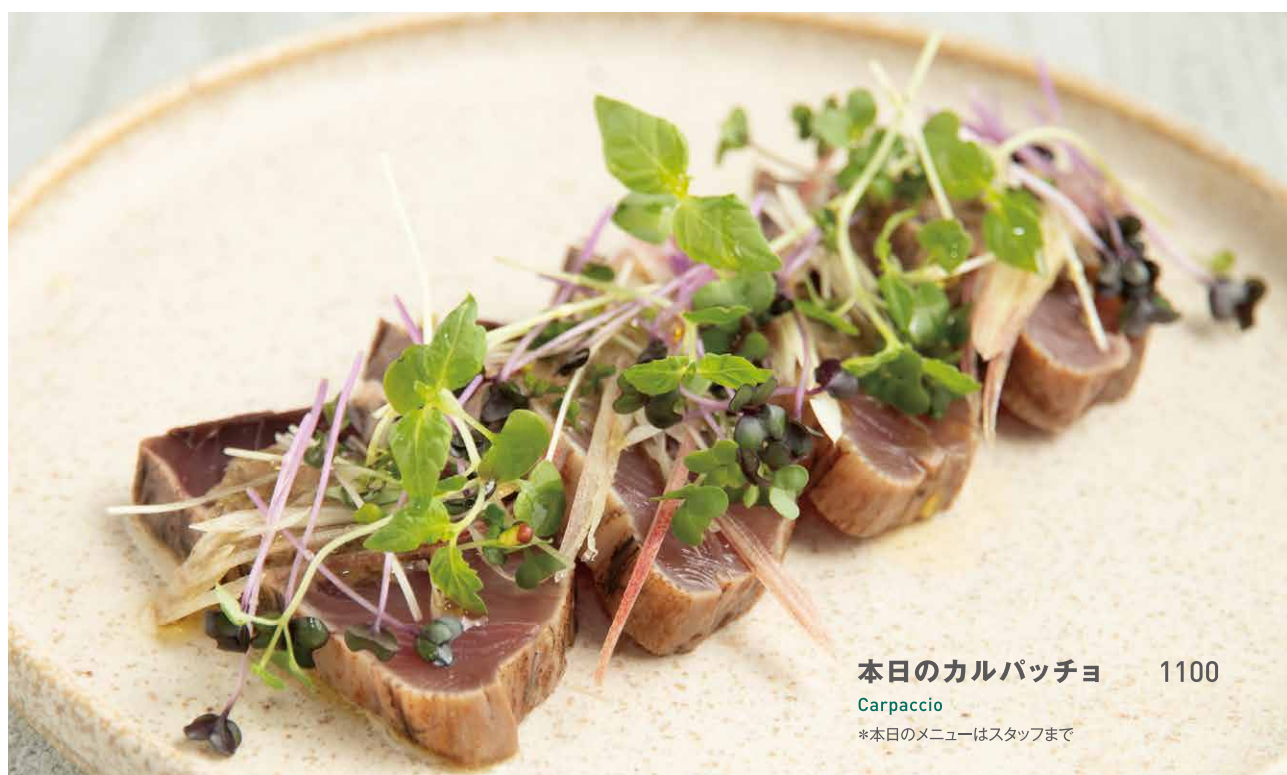
本日のカルパッチョ 1100 Carpaccio *本日のメニューはスタッフまで