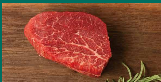
国産 牛フィレステーキ

ファーマーズクラブはシェフこだわりの牛肉を仕入れ一番美味しい状態でお食事いただけるよう、ステーキをご提供させていただいております。どうぞ牛肉の味わいをお楽しみください。