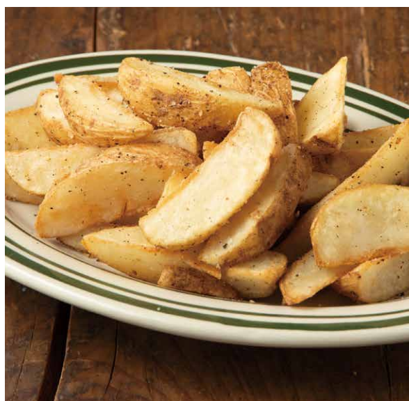
フライドポテト 550 <ソルト/ガーリックペッパー/トリュフ風味> French Fries