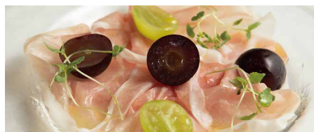
生ハムと 季節のフルーツ Prosciutto And Seasonal Fruit