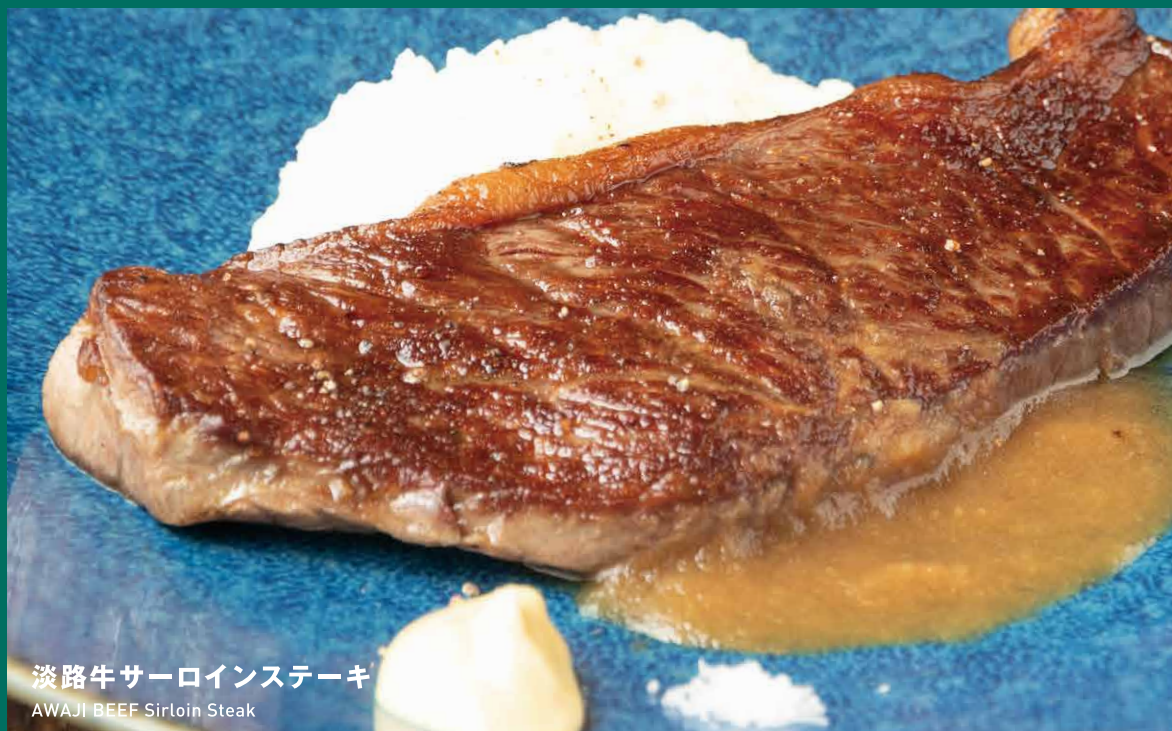
淡路牛サーロインステーキ