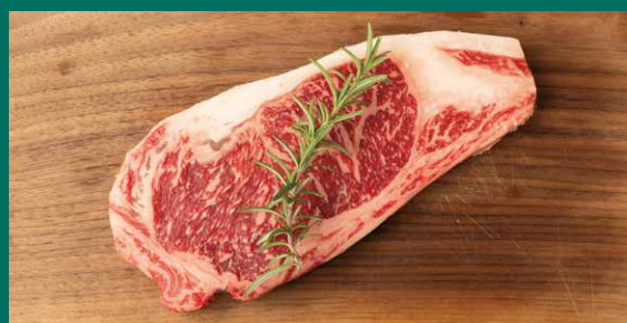
淡路牛サーロインステーキ