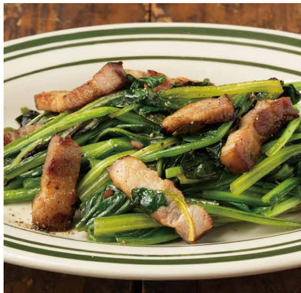
ほうれん草とベーコンのバターソテー 700 Spinach And Bacon Sautéed In Butter