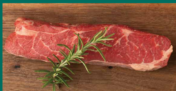
US産 牛肩ロースステーキ

”肉の女王”とも称されるほどのキメの細かい赤身で、脂身が少なく、柔らかいのが特徴。