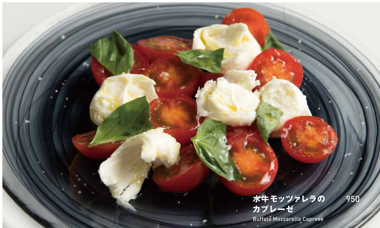
水牛モッツァレラのカプレーゼ 950 Buffalo Mozzarella Caprese