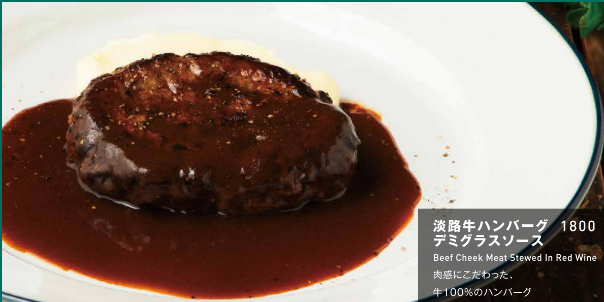
淡路牛ハンバーグ 1800 デミグラスソース